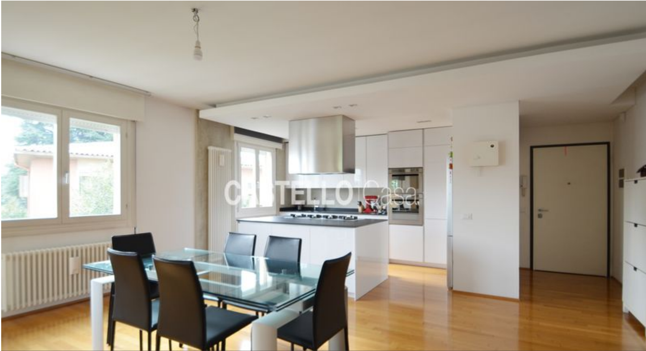
Castelfranco v.to - luminoso appartamento in vendita